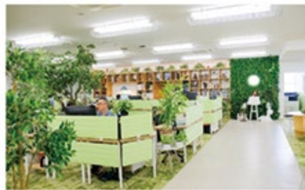
社員が企画した働きやすい環境を整えたオフィス

経理や法務、社会保険関連の手続きなどが主な業務です。また、総務部と連携しながら健康経営の一端も担っています。企業風土として、人との繋がりを大切にお互いを尊重し協力し合う「大家族主義」が根付いています。まずは、社員とその家族が心身健康に暮らせることを基盤に、働きやすい環