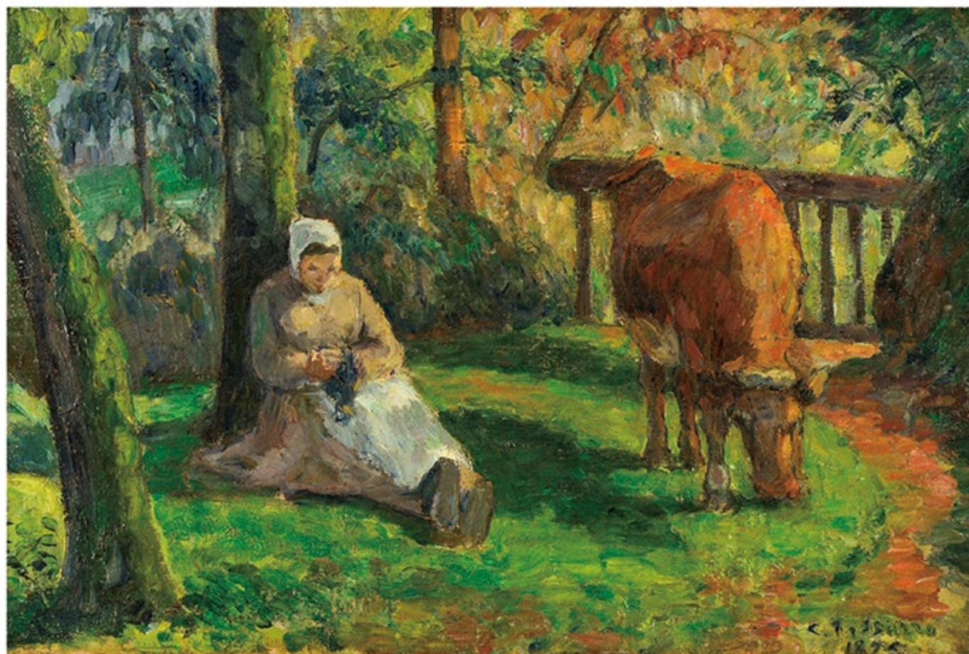
カミーユ・ピサロ《牛の番をする農婦、モンフォー》(岐阜県美術館 所蔵名品®)