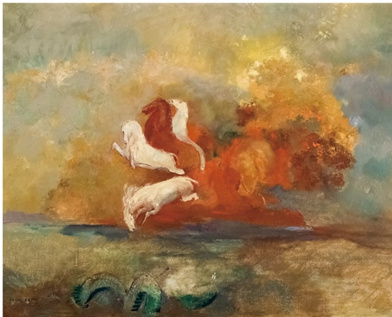
オディロン・ルドン《アポロンの戦車》(岐阜県美術館 所蔵名品 ® )