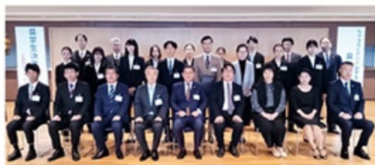
奨学生決定証書授与式(集合写真)

これからの岐阜・愛知県を担っていく若者の教育機会を経済的側面から支援しています。